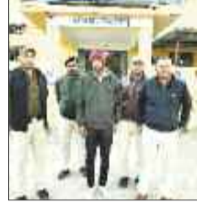
उसे तत्काल 108 से जिला चिकित्सालय पुलिस जवानों के साथ भेजा गया।

नगर में इन दिनों नशीली दवाओं के कारोबारी फलने फूलने लगा है। पुलिस द्वारा बीच बीच में कार्रवाई करती है परंतु नशीली दवाओं और मादक पदार्थों के खरीदी बिक्री