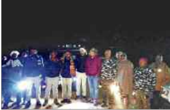
ग्रामीणों को सुरक्षित स्थान पर भेजते वनकर्मी।

बल्कि आसपास के आधा दर्जन गांव में लगी फसल को नुकसान पहुंचाया है। हालांकि वन विभाग पर निगरानी रखे हुए है और ग्रामीणों को सुरक्षित स्थान पहुंचा रहे हैं जिससे अभी तक किसी प्रकार की अप्रिय घटना नहीं हुई है।