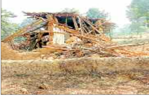
हाथियों द्वारा ढहाया गया घर।

नौ हाथियों के दल ने पीछले 9 दिनों से सूरजपुर व उदयपुर क्षेत्र में जमकर उत्पात मचा रहा है। उदयपुर व सूरजपुर सीमावर्ती क्षेत्र में डटे हाथियों के झुंड ने नौ दिन के भीतर न सिर्फ 10 घरों को क्षतिग्रस्त किया