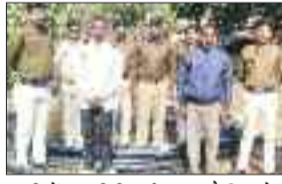
बाड़ी में एचडीपी पाइप लगा है जिसके बाद उसे दिवश देकर पकड़ा गया।