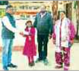
दिव्यांग बच्चों को छात्रवृत्ति प्रदान किया गया।

रामानुजनगर। विकासखंड रामानुजनगर के बीआरसी हजारीताल चक्रधारी द्वारा दिव्यांग छात्राओं को समाज कल्याण छात्रवृत्ति योजना के अंतर्गत छात्रवृत्ति प्रदान किया। विकासखंड के स्कूलों से छत्तीसगढ़ शासन की महत्वाकांक्षी योजना के अंतर्गत 84 दिव्यांग बच्चों को छात्रवृत्ति प्रदान किया गया।